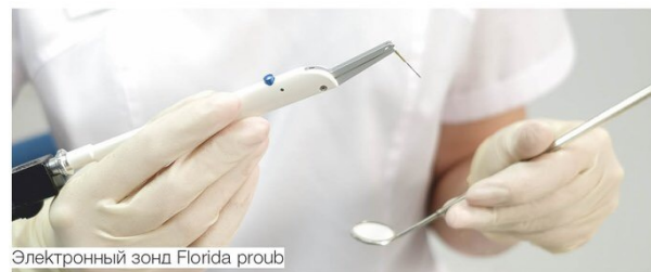
Электронный зонд Florida proub